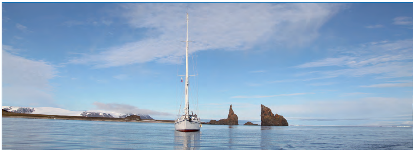
Яхта «Aletr Ego» – экспедиционное судно краеведческой экспедиции в «Русскую Арктику-2012» – у мыса Тегетхоф, Земля Франца-Иосифа.

Особое внимание уделялось обследованию морских террасовых комплексов и древних береговых валов и отбору с разных их уровней органического материала – плавника, костных останков китов, ракуши. Углеродный анализ этих остатков позволит определить возраст формирования древних береговых валов и террасовых комплексов в голоцене, т.е. в последние десять тысяч лет. Кроме того были отобраны колонки донных отложений из непромерзающего озера на острове Циглера и мелководного залива Ловушка на острове Земля Вильчека. Контактное картографирование местоположений ледниковых кромок будет сопоставляться с данными исторических и синхронных дистанционных съемок, что позволит сделать более аргументированные выводы о динамике ледникового покрова. Но уже и сейчас можно говорить о значительном сокращении площади отдельных выводящих ледников. В некоторых ледниках удалось выявить морфологические признаки, которые могут указывать на пульсационный режим развития этих ледников. В настоящее время о распространении этого явления на Земле Франца-Иосифа нет никакой информации.