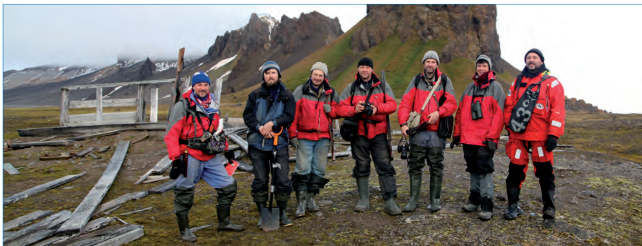
Научная группа на мысе Тегетхоф, о. Галля, Земля Франца-Иосифа.

Впервые на архипелаге заложена серия представительных разрезов и профессионально отобраны образцы почв для аналитических исследований их состава и структуры, почвенных процессов. Довольно развитые почвенные профили и признаки активных почвенных процессов обнаружены не только в местах, обогащенных гуано под птичьими базарами, но и в ряде мест с благоприятны-