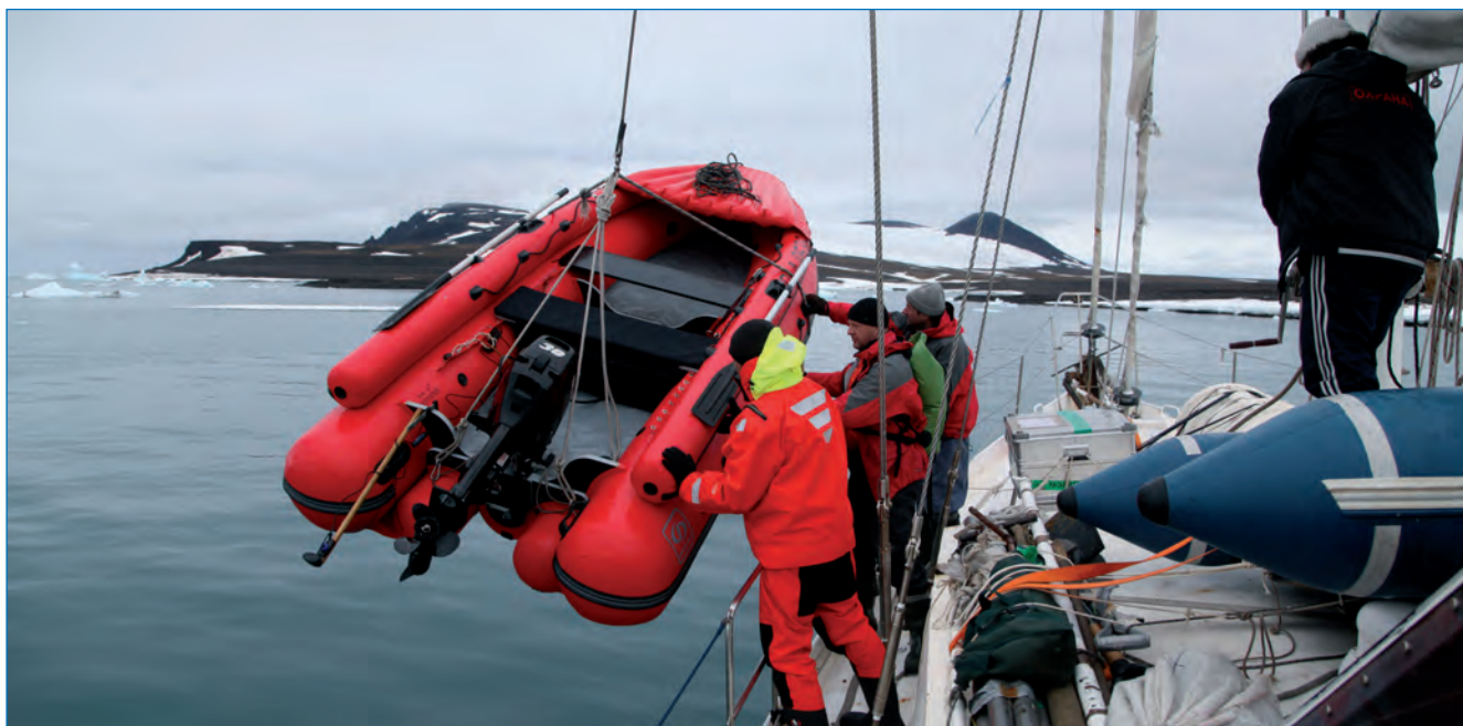
Рабочий момент экспедиции.

По совместному с Пермским государственным университетом проекту были выполнены сборы амфибиотических насекомых, по предварительным данным на